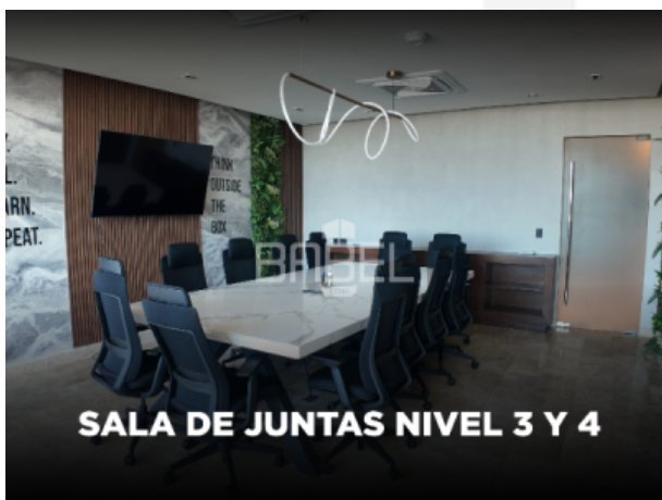
SALA DE JUNTAS NIVEL 3 Y 4