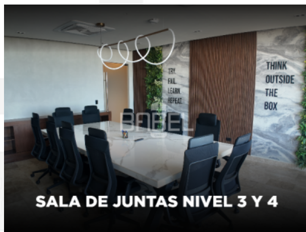
SALA DE JUNTAS NIVEL 3 Y 4